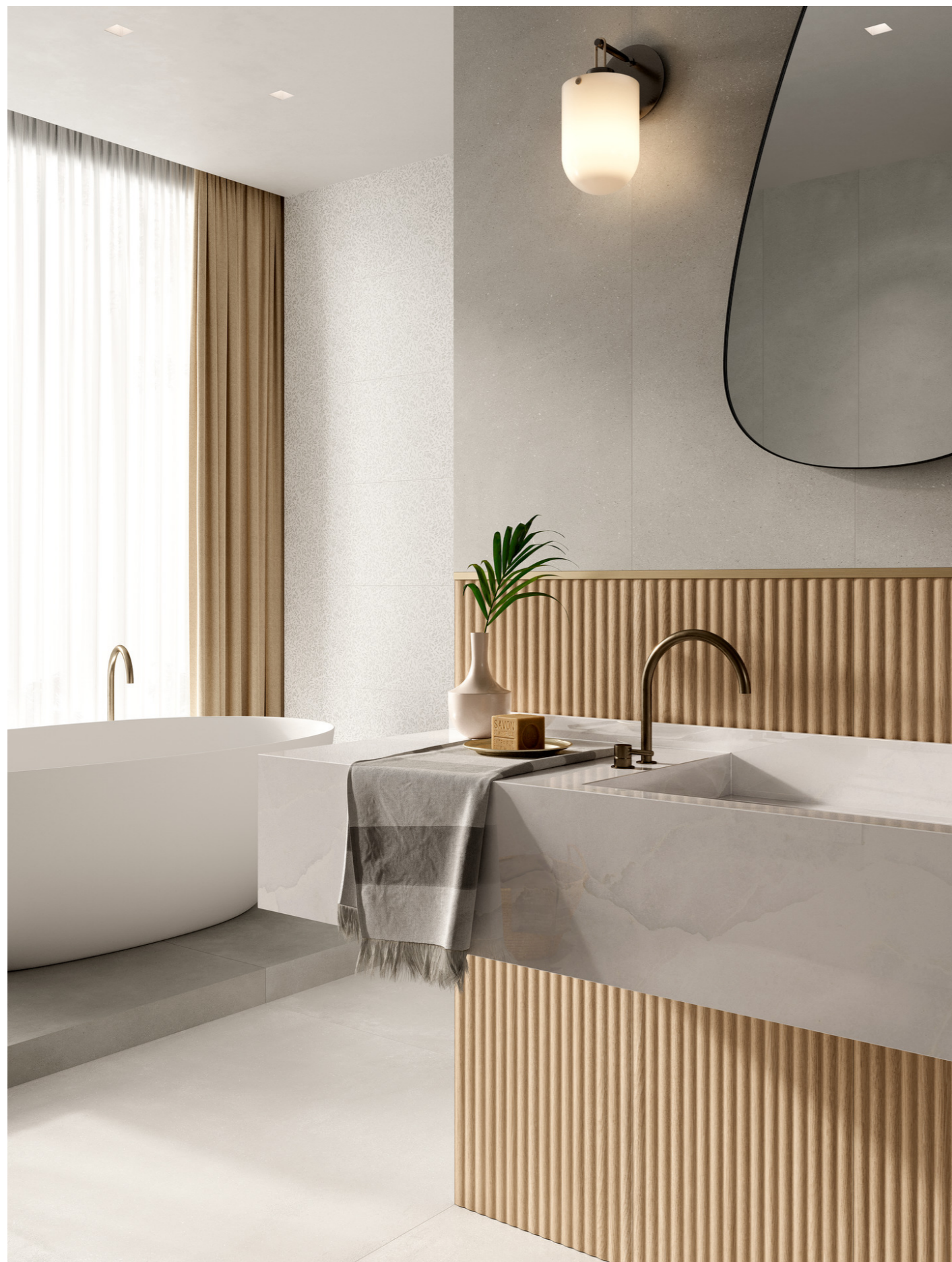
MPCG Slow Cold Gesso Rt 120x120cm MPC2 Slow Wall Cromo Rt 40x120cm MPC1 Slow Wall Decoro Myrtle Gesso Touch Rt 40x120cm M9D1 Grande Marble Look Onice Bianco Lux Rettificato 120x278cm