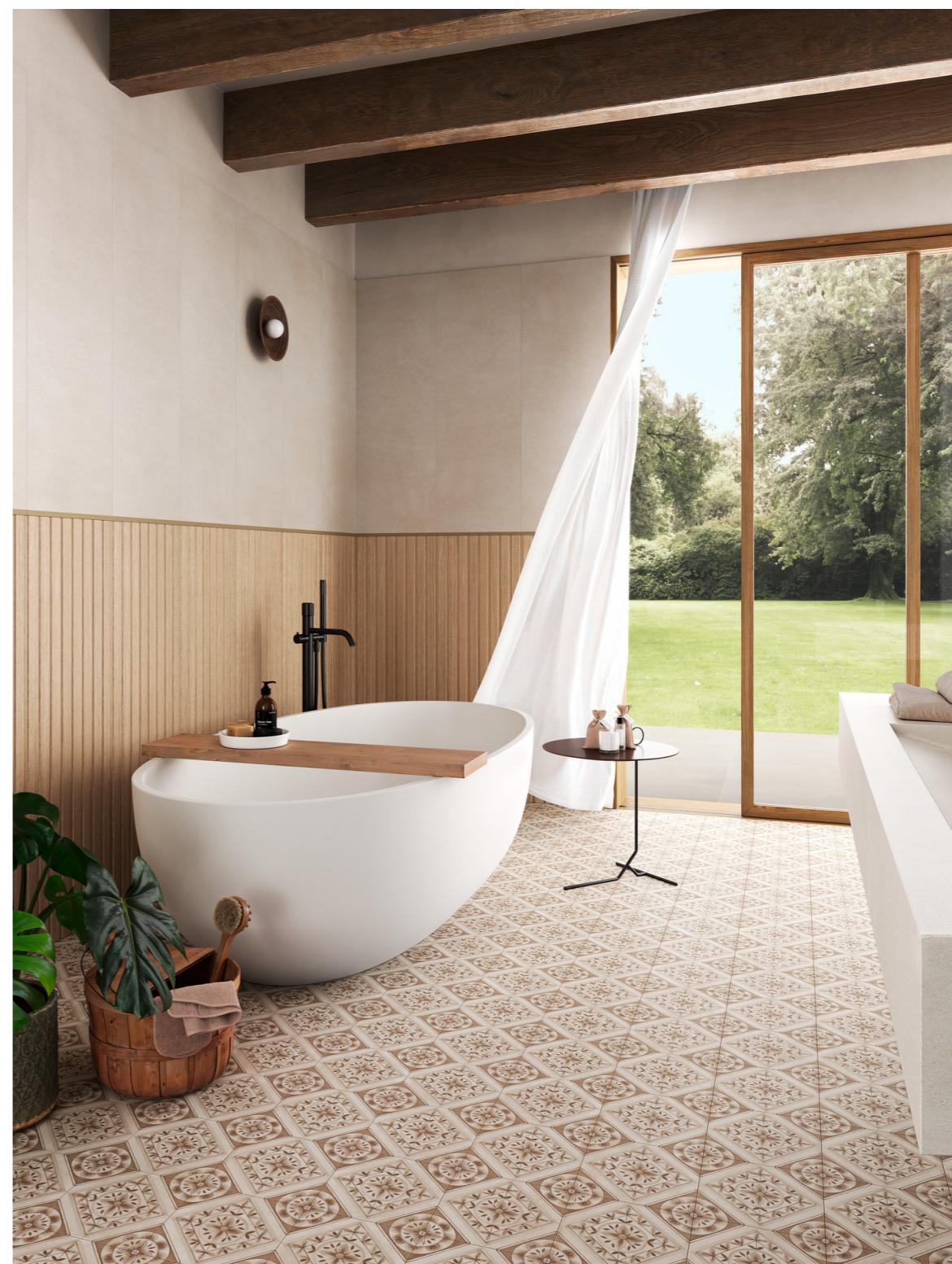
MQ71 Grande Concrete Look Slow Pomice Satin 3D Ink Rt 160x320cm MPC3 Slow Wall Pomice Rt 40x120cm MP3H Slow Pomice Strutturato Rt 120x120cm MH5Y Artcraft Pomice Decoro Quadri 20x20cm