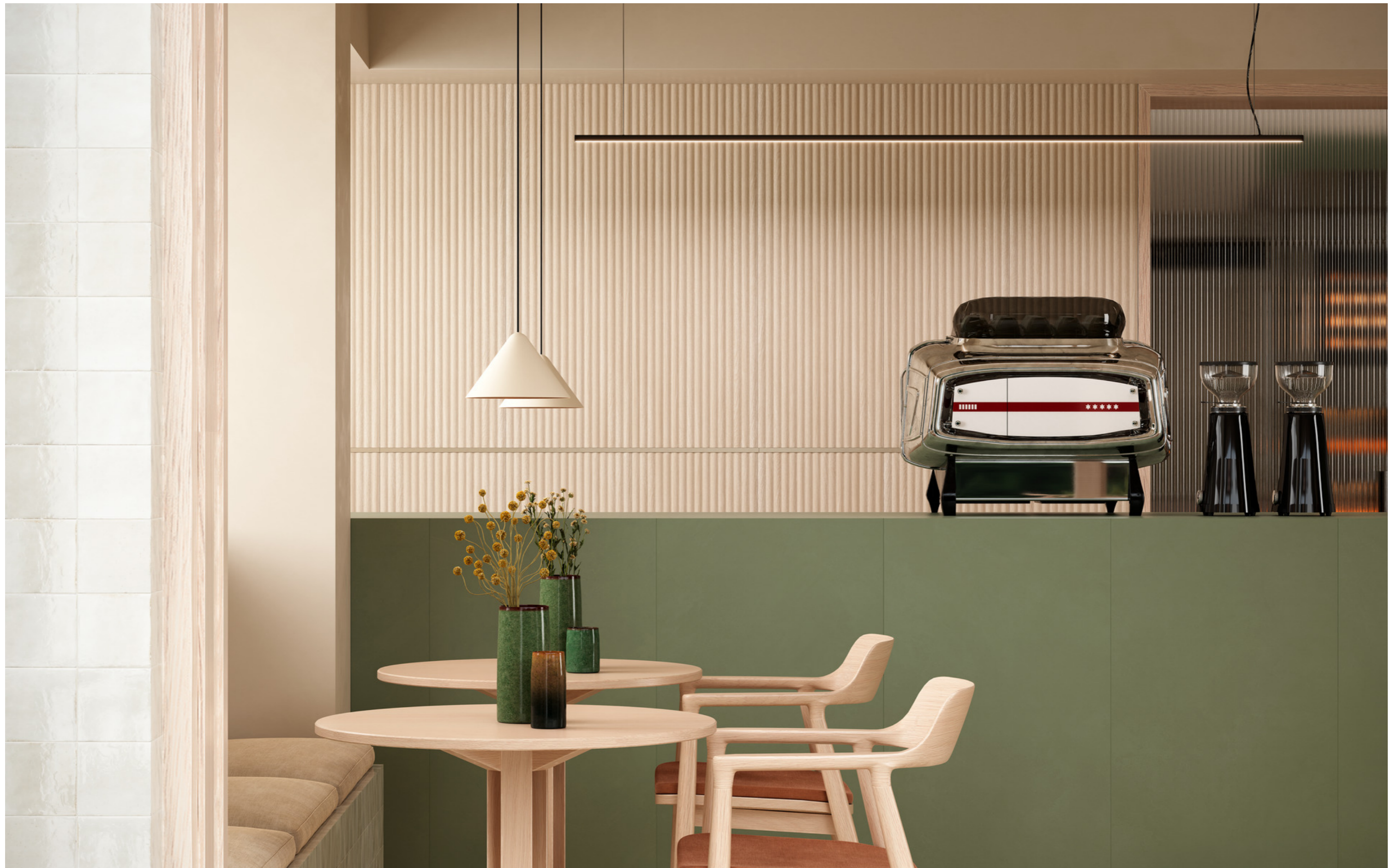
MQ7Y Lume Bone Lux 10x10cm MALX Grande Resin Look Verderame Satin Rt 120x278cm