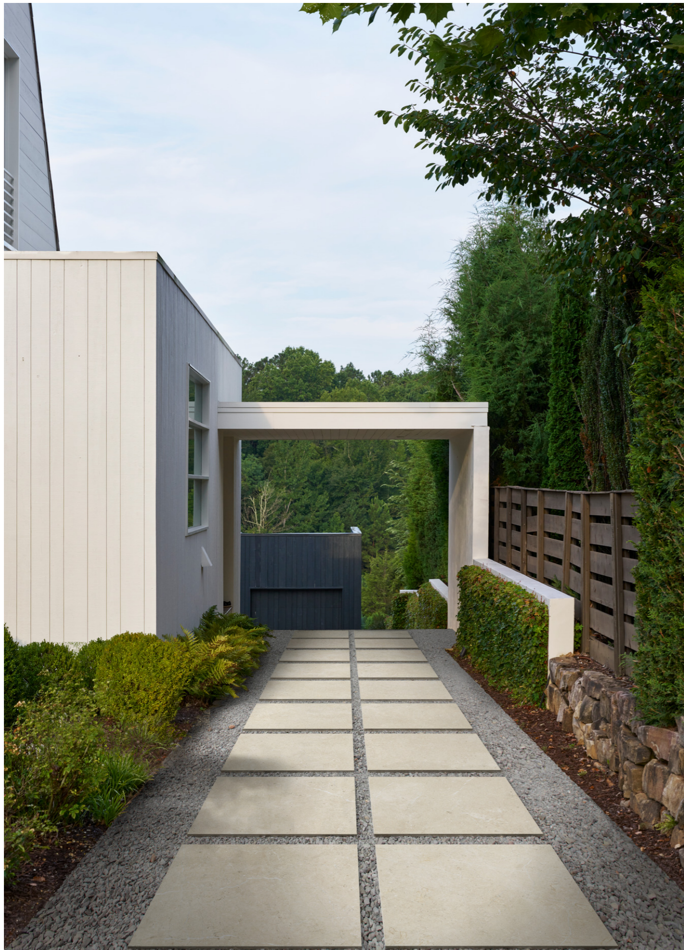
RD5U Viaggi20 Ivory Rt 60x60cm